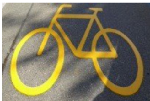
Markierung der Velostrassen

Die Velostrassen werden mit einem Velosymbol auf der Strasse markiert. Bei allen einmündenden Querstrassen wird der Rechtsvortritt mit den Verkehrssignalen «Stop» oder «kein Vortritt» aufgehoben, sodass auf den Velostrassen Velo- und Autoverkehr vortrittsberechtigt sind.