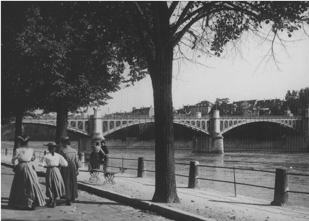
Rheinuferweg mit Wettsteinbrücke, 1879

Uns ging es bei dieser Intervention darum, dass das historisch gewachsene Erscheinungsbild des Rheinufers (auch auf der Grossbasler Seite am St. Alban-Rheinweg) nicht durch diese zahlreich aufgestellten 'Solarkübel' beeinträchtigt wird. Für die konstruktive Zusammenarbeit bedanken wir uns an dieser Stelle bei allen Beteiligten.